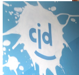
GraffitiProjekt über „Ich bin Kunst“